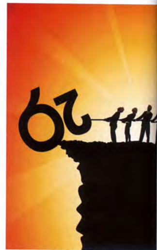
MEDIA SERVICES GRAPHICS